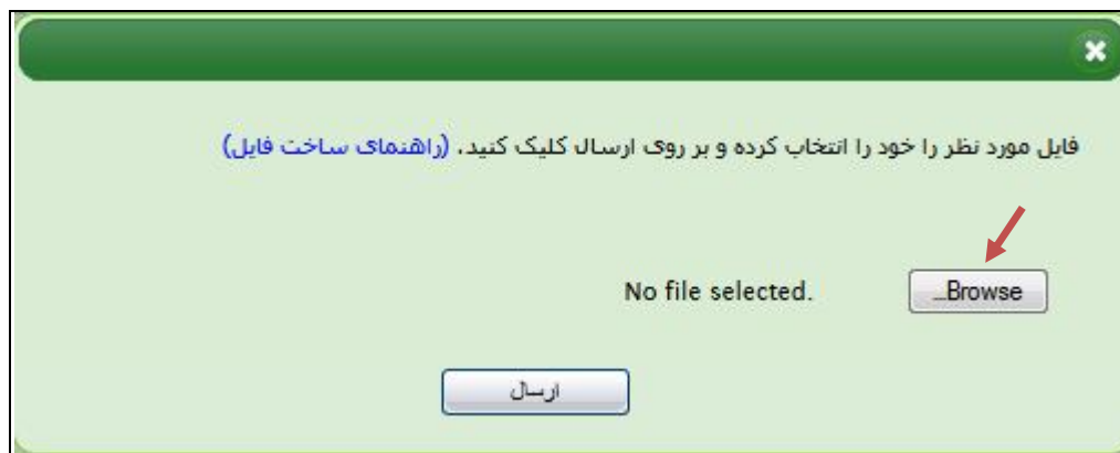
تصویر شماره (2)