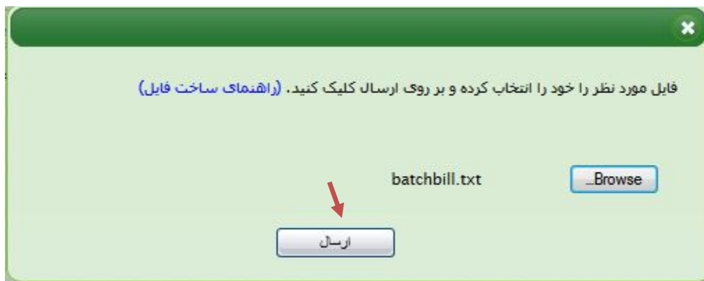
تصویر شماره (4)